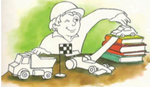
GIOCARE CON LE MACCHININE