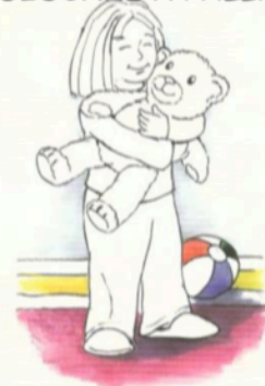
GIOCARE CON L'ORSETTO