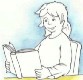
LEGGERE UN LIBRO

Mi piace... Colora le attività che ti piacciono.