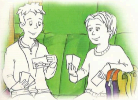
GIOCARE CON LE FIGURINE