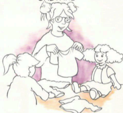
GIOCARE CON LE BAMBOLE