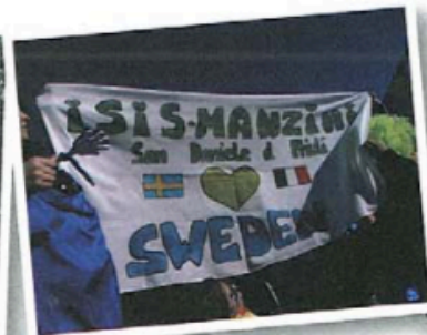
fare il gemellaggio con un'altra scuola