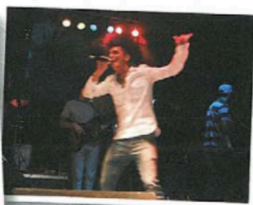
cantare in un concorso