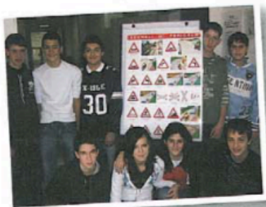
fare lezioni di guida

Osservate le seguenti attività e iniziative. Di solito, quali di queste è possibile svolgere a scuola?