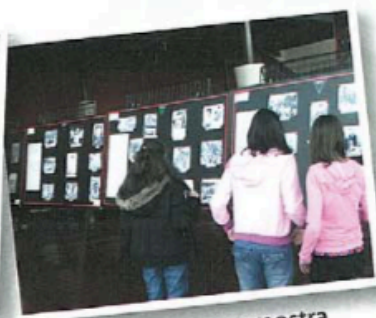
organizzare una mostra