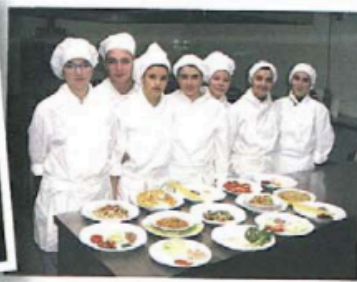
fare lezioni di cucina