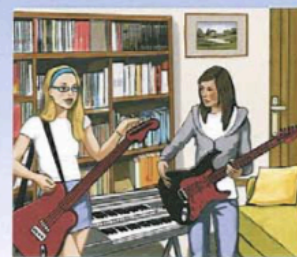
Quando il concorso sarà finito, saremo delle stelle!