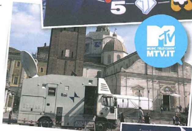
Festival della canzone italiana