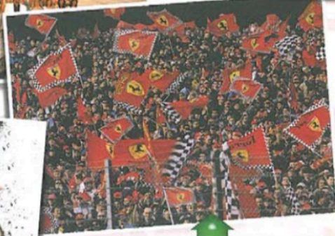
Gare di Formula 1 e Moto GP