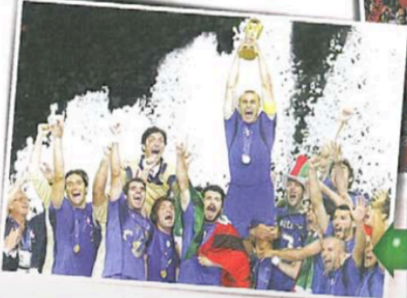
Partite del Campionato e della Nazionale